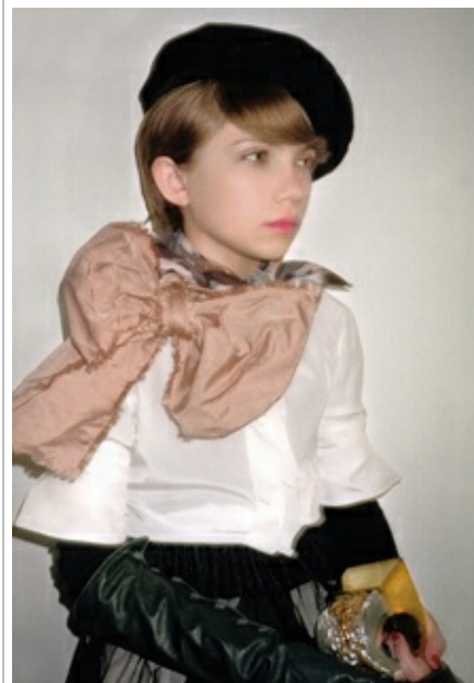
Tavi Gevinson, sólo tiene 13 años y un estilo muy pero que muy peculiar.